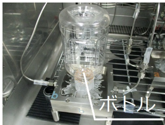
写真2 PETボトルの透過度測定