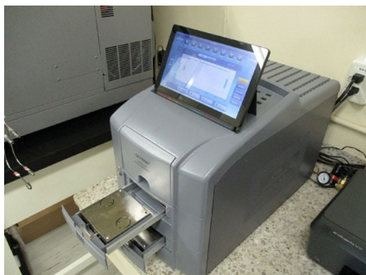
写真1 測定装置（フィルム・シート測定）