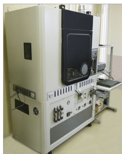
写真 マルチカロリメータ

一般財団法人化学研究評価機構 (JCII) 高分子試験・評価センターでは、厳正・公平・守秘をモットーに試験・検査を受託しております。まずはお問い合わせ下さい。