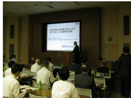
写真 昨年の JCII 標準化調査研究発表会 風景