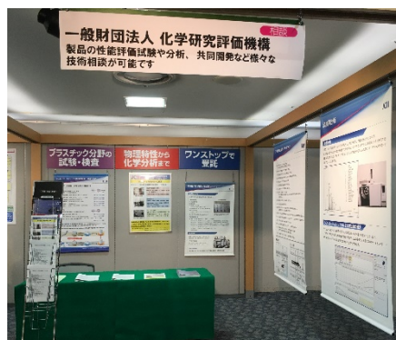
写真 弊機構の出展ブース

熱分析や製品の品質管理に関心がございましたら、高分子試験・評価センターまでお気軽にお問い合わせ下さい。