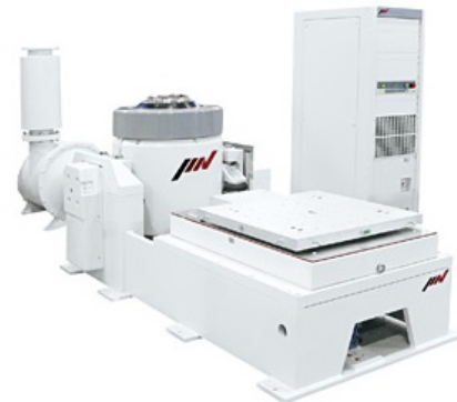
図 1 振動試験機