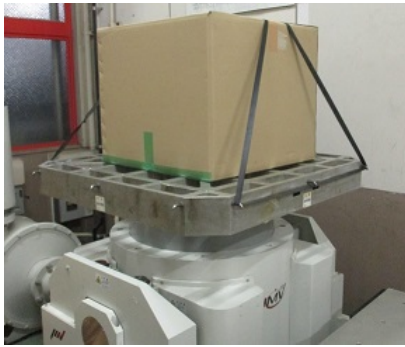
写真 1 梱包した貨物の振動試験風景

梱包した状態で振動試験機に設置し、輸送を想定した耐震性を確認したときの状況（写真 1）及び耐震マットの効果を気象庁が公表しているデータ（図 2）を基に試験条件を設定して耐震性を確認したときの様子です（写真 2）。